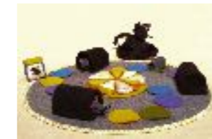
La chasse au fromage