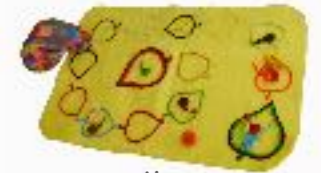
La course d'escargots